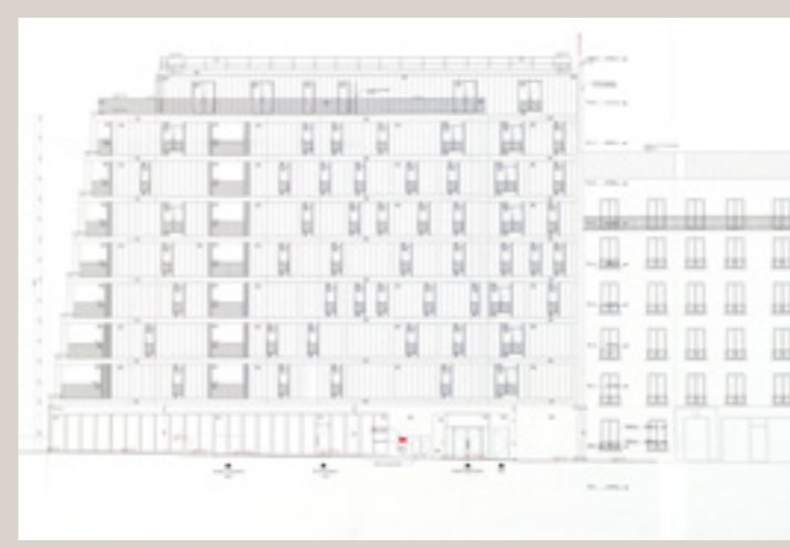
Élévation Sud projetée (© Gillot+Givry architectes).