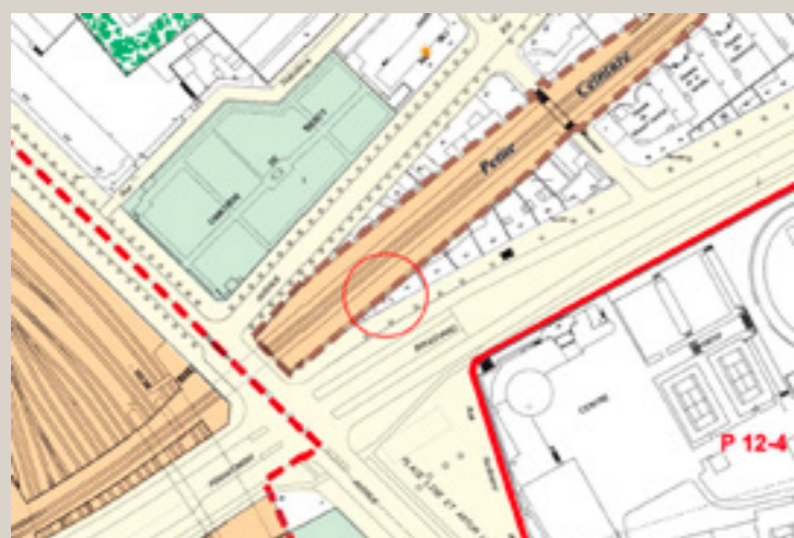
Extrait du P.L.U.

Le n° 15 a conservé, au rez-de-chaussée, une brasserie d'origine mais le reste a été remanié. Le n° 19 a été complètement réaménagé intérieurement pour être transformé en maison de ville. Il présente en façade une modénature obtenue par le seul calepinage de briques ocre et beige et conserve un escalier ainsi que deux