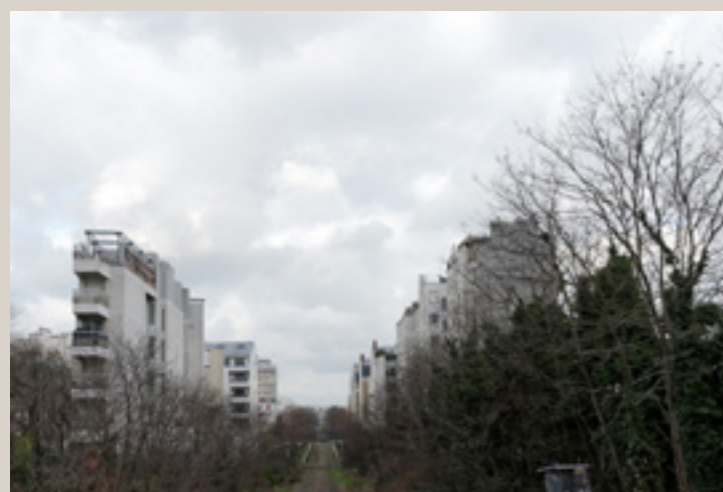
Vue actuelle des bâtiments de part et d'autre de la ligne de la Petite Ceinture.

- Archives de Paris : 3589W 1833 ; D 4 P 4 901 ; VO 21 2783.