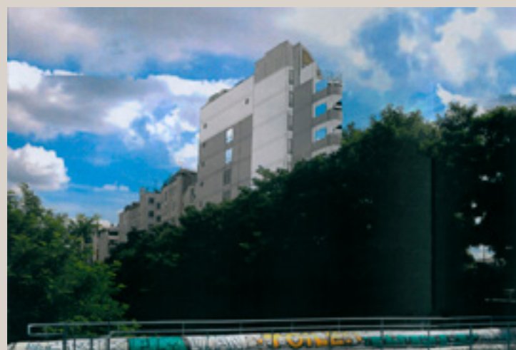
Vue d'insertion, depuis la ligne de la Petite Ceinture, du projet présenté en février 2017.