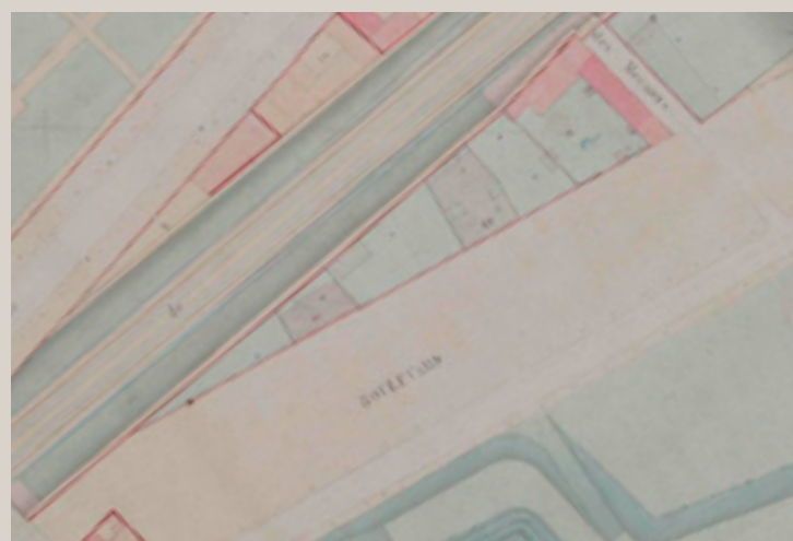
Extrait du cadastre de 1891.