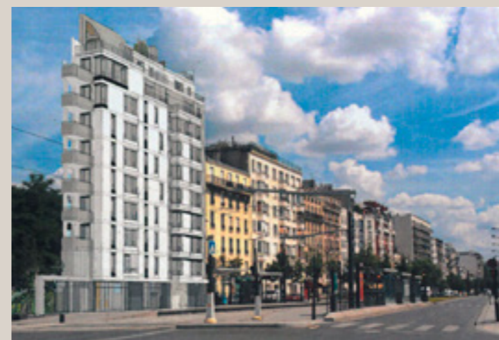
Vue d'insertion du projet présenté en février 2017 (© Jérôme Leroy architecte).