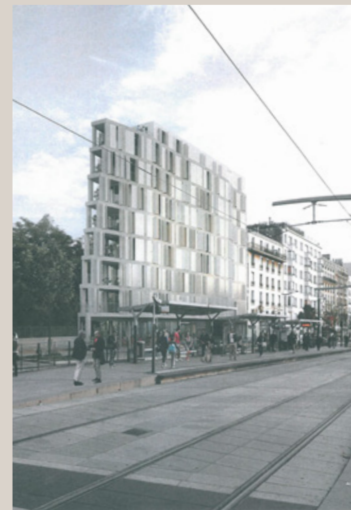
Vue d'insertion du nouveau projet depuis l'avenue de la Porte de Charenton (© Gillot+Givry architectes).