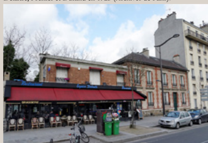
Vue actuelle des deux maisons depuis le boulevard.