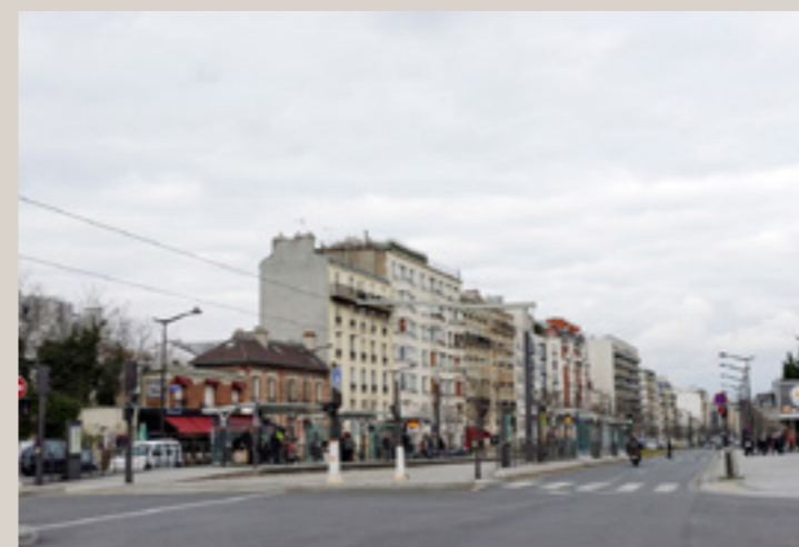
Vue actuelle du boulevard Poniatowski depuis l'avenue de la Porte de Charenton.