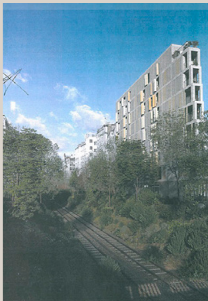
Vue d'insertion du nouveau projet depuis la ligne de la Petite Ceinture (© Gillot+Givry architectes).