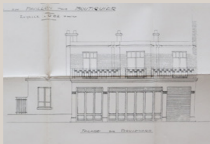
Élévation de la façade du 15, boulevard Poniatowski, dessinée par Delaitre, Prunier et Durand en 1923 (Archives de Paris).